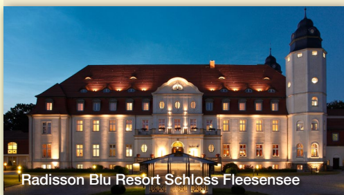
Radisson Blu Resort Schloss Fleesensee

Eine Übernachtung im Doppelzimmer im Schloßhotel vom 11.06. – 12.06.11, inklusive reichhaltiges Frühstücksbuffet, Golfturnier auf dem Scandinavian Course, Halfwayhouse-Verpflegung, Cocktailempfang, Galadinner, 3-stündige Trainingseinheit